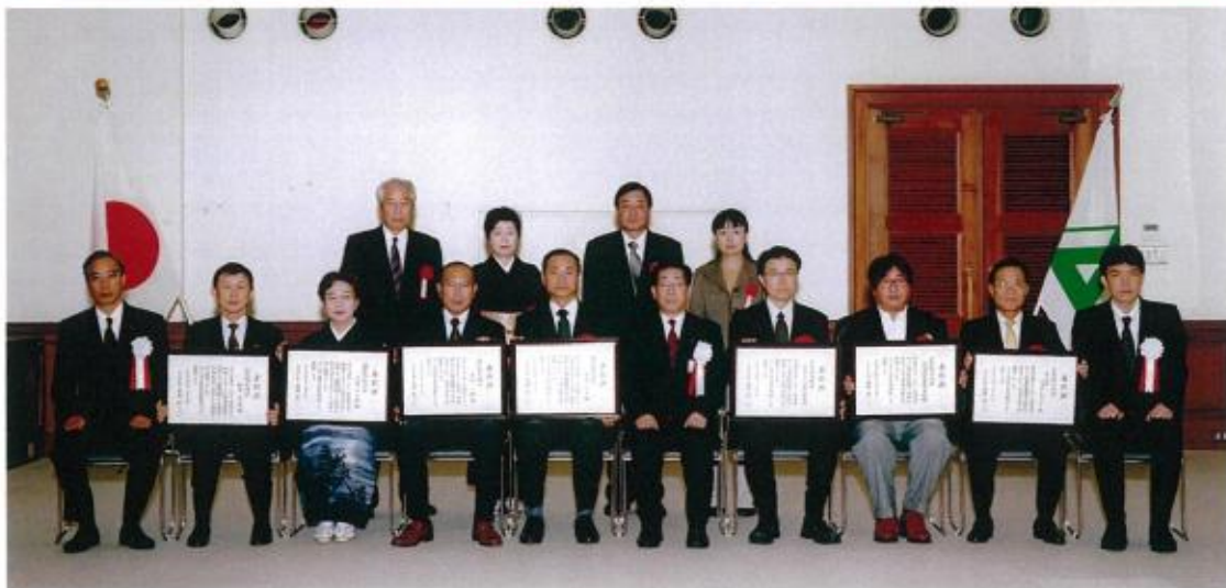
平成24年度富山県技能職能功労及び産業経済功労(職業能力開発優良企業)表彰式 平成24年11月16日(金) 富山県庁本館